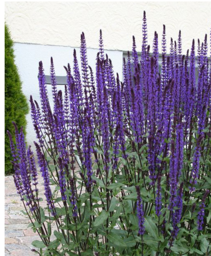
Salvia nemorosa 'Caradonna'