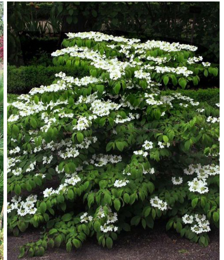
Viburnum plicatum ,Mariesii'