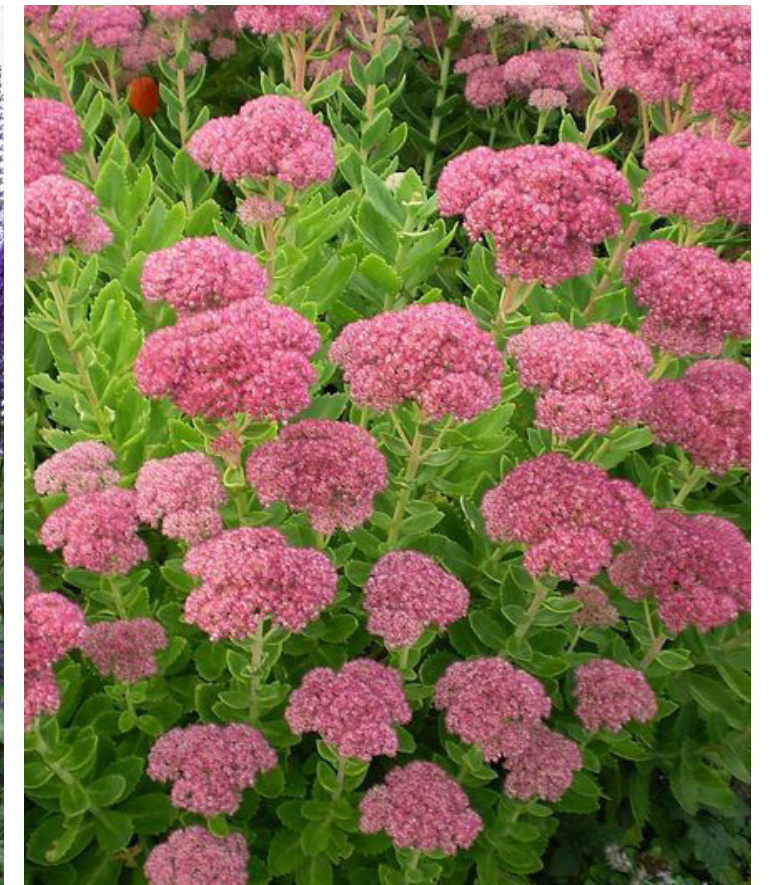
Sedum spectabile 'Carl'