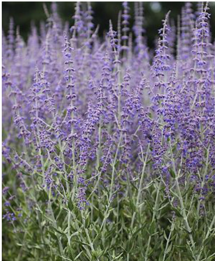
Perovskia atriplicifolia 'Blue Spire'