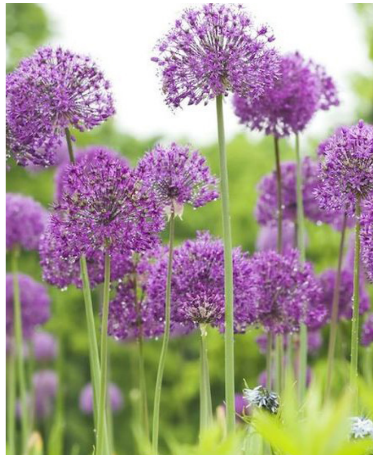
Allium aflatunense ,Purple Sensation'