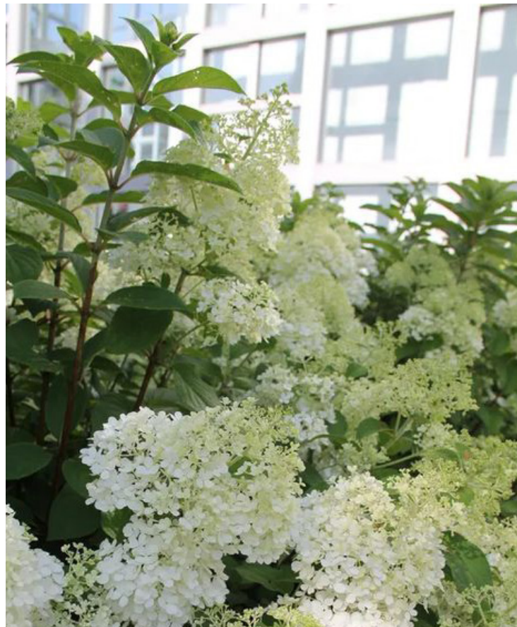
Hydrangea paniculata ,Grandiflora'