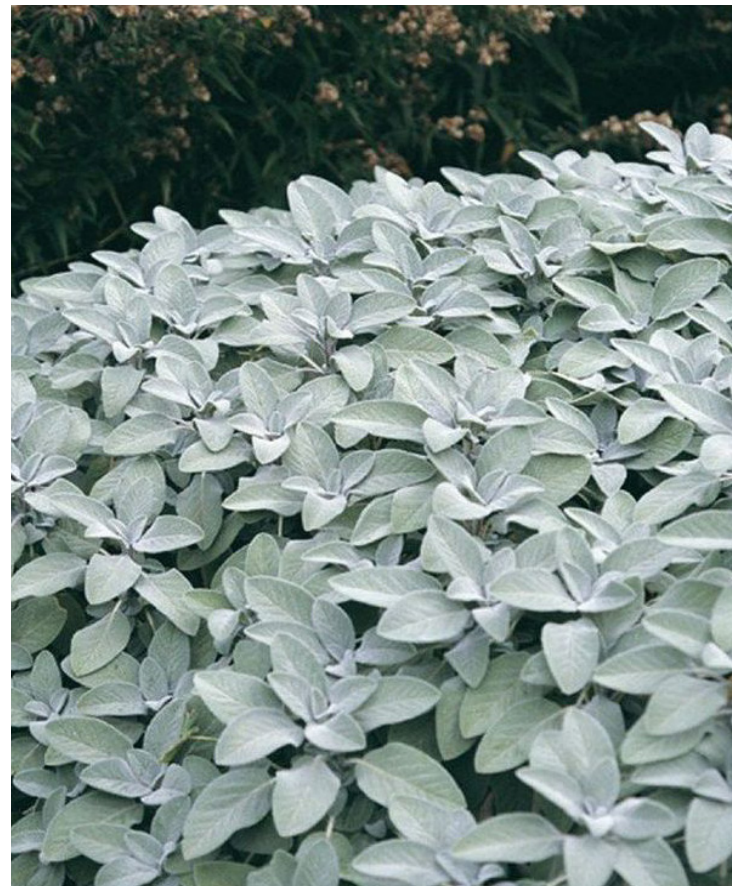
Salvia officinalis ‚Berggarten‘