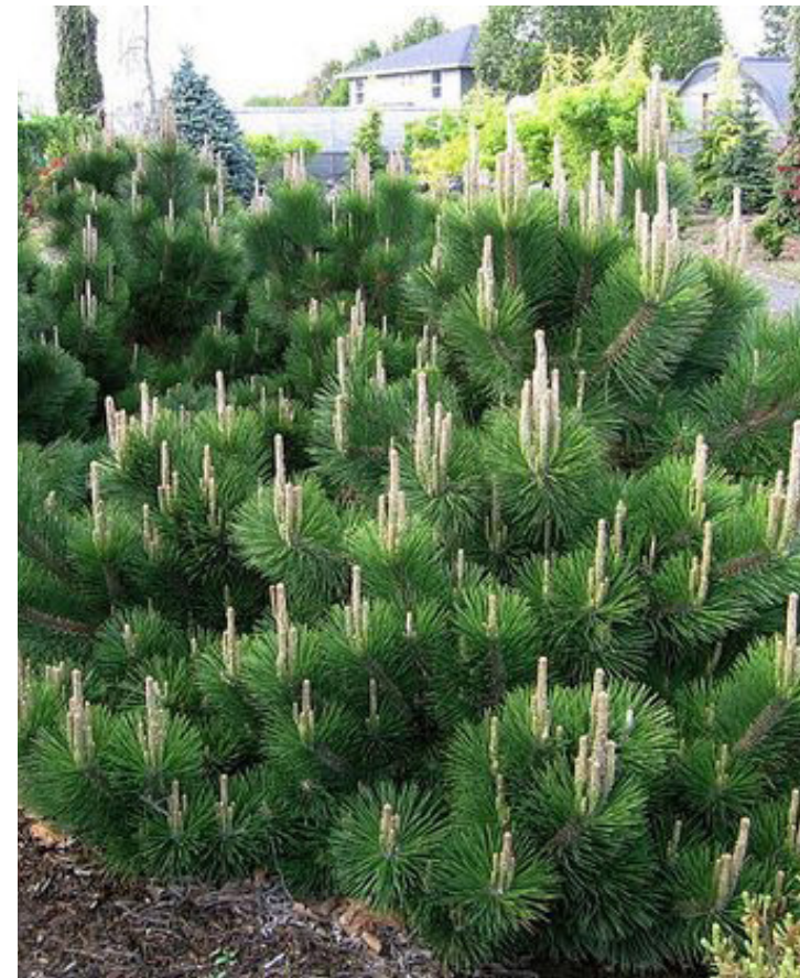
Pinus mugo var. Pumilo