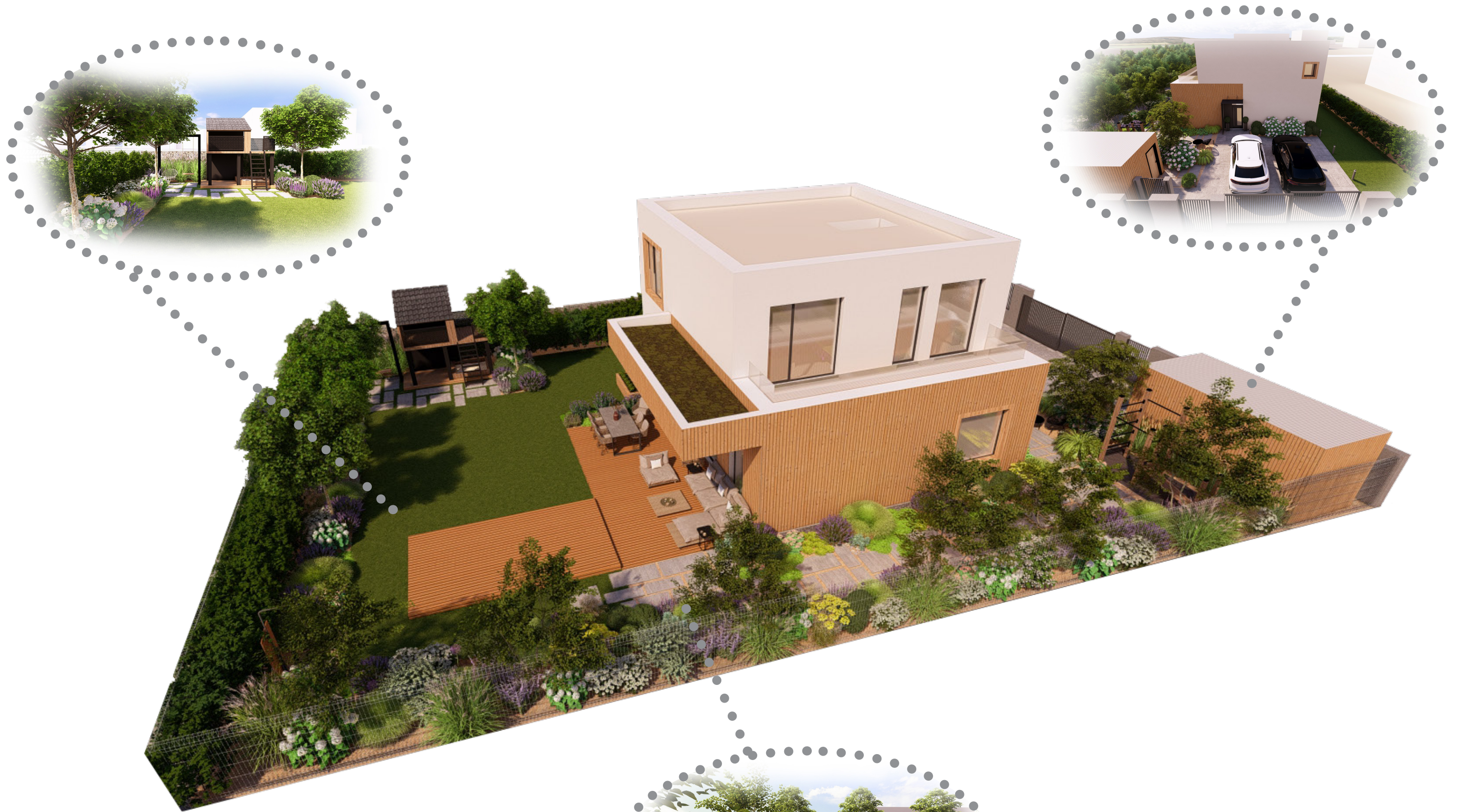
Zobrazení výškového uspořádání zahrady pomocí axonometrie