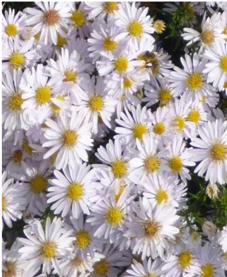
Aster dumosus 'Apollo' hvězdnice/astra