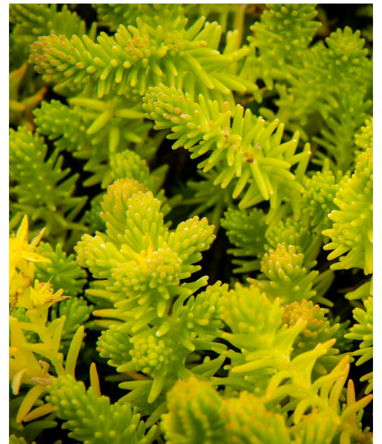
Sedum sexangulare ‚Weisse Tatra‘