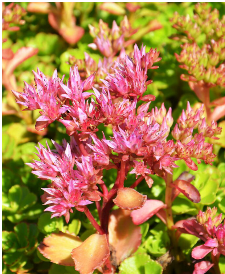
Sedum spurium ‚Voodoo‘