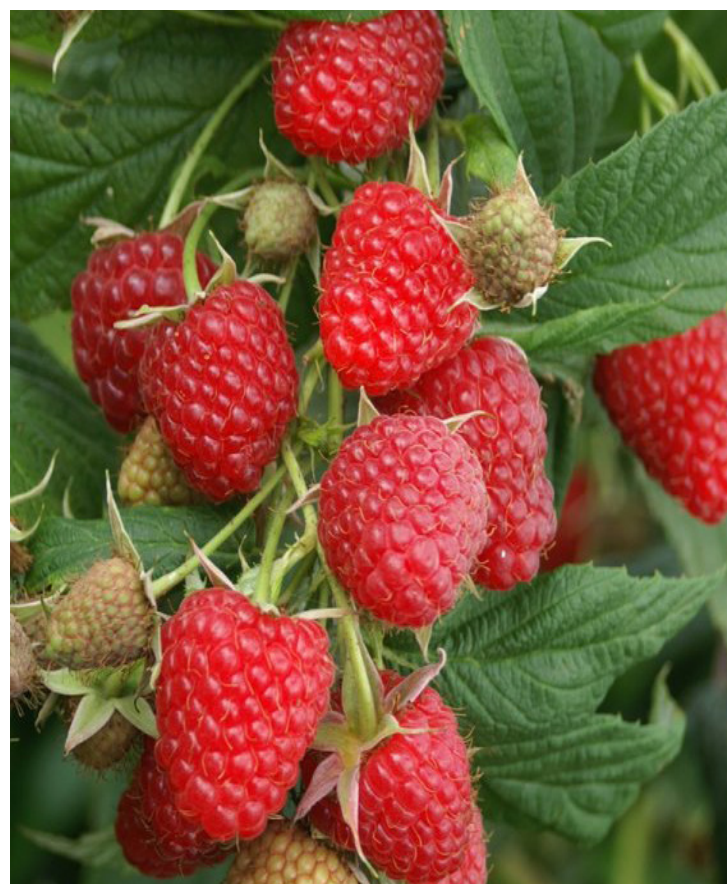
Rubus idaeus ‚Polka‘