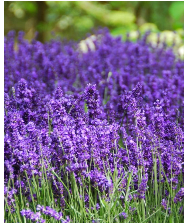
Lavandula angustifolia 'Hidcote Blue'