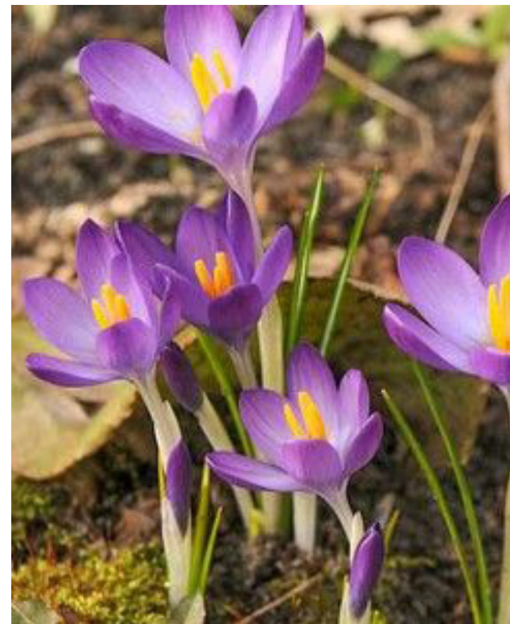
Crocus tommasinianus ,Barr's Purple'