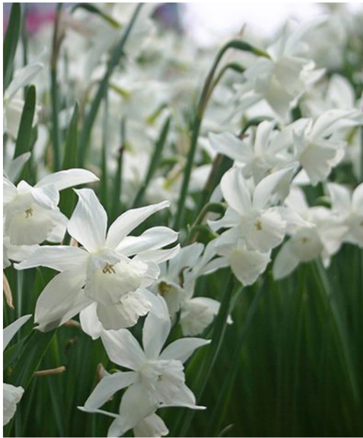
Narcissus Triandrus ,Thalia'