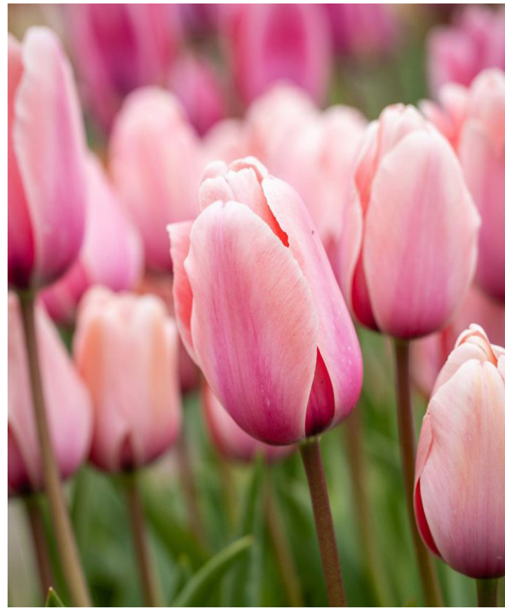
Tulipa Darwin hybrid ,Pink Impression'