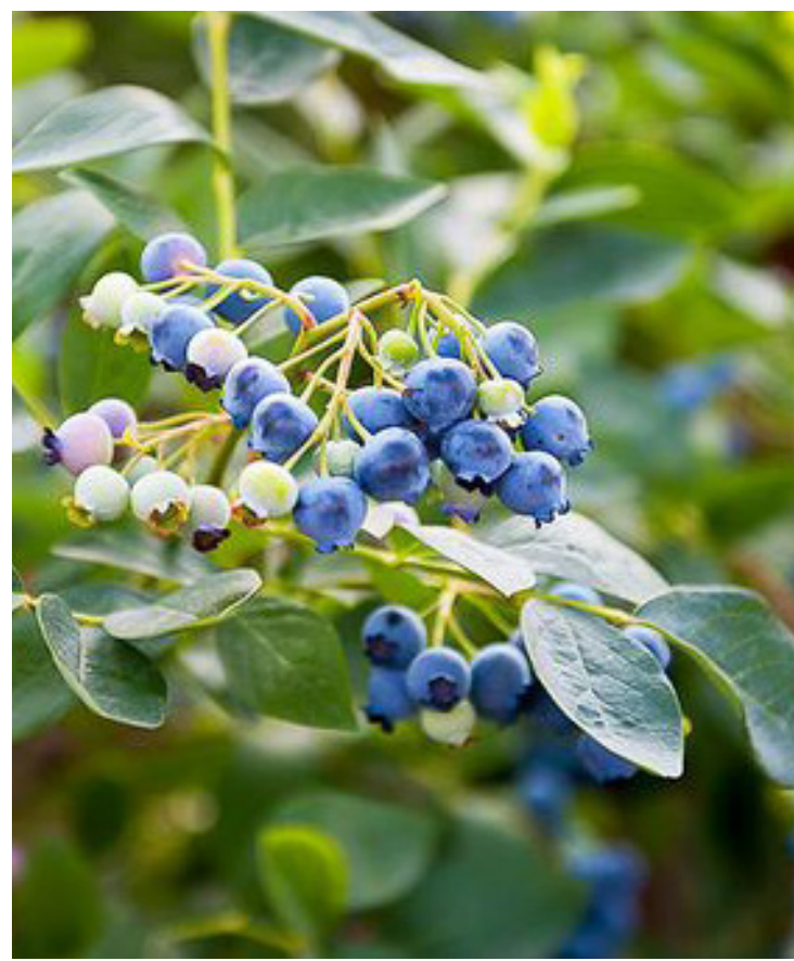
Vaccinium corymbosum ‚Bluecrop‘