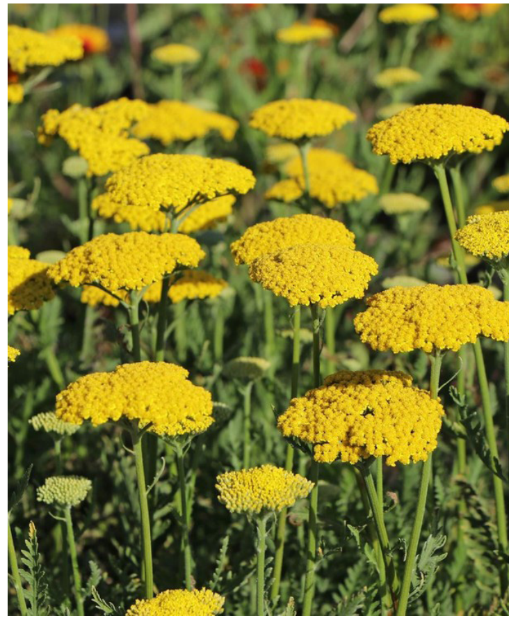
Achillea filipendulina 'Summer Gold'