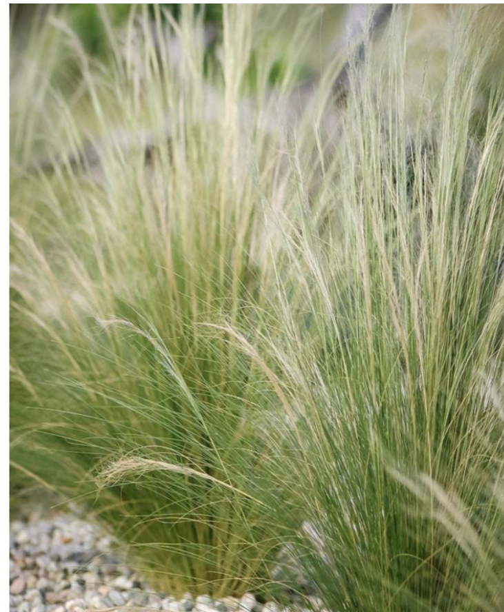
Stipa tenuissima ,Ponytails‘