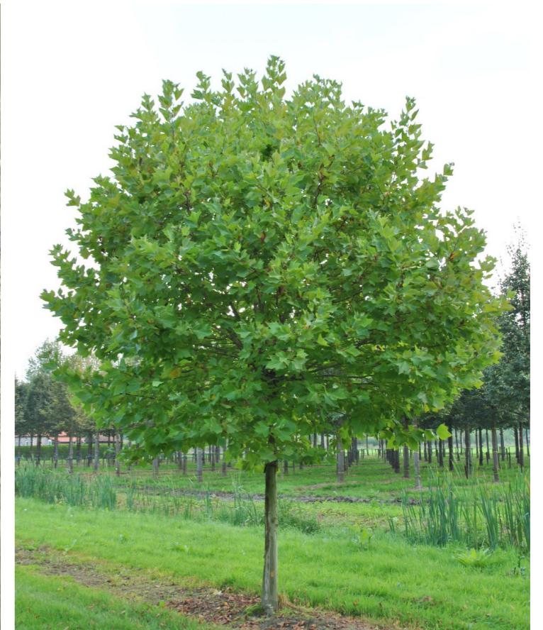
Platanus acerifolia ,Alphens Globe‘