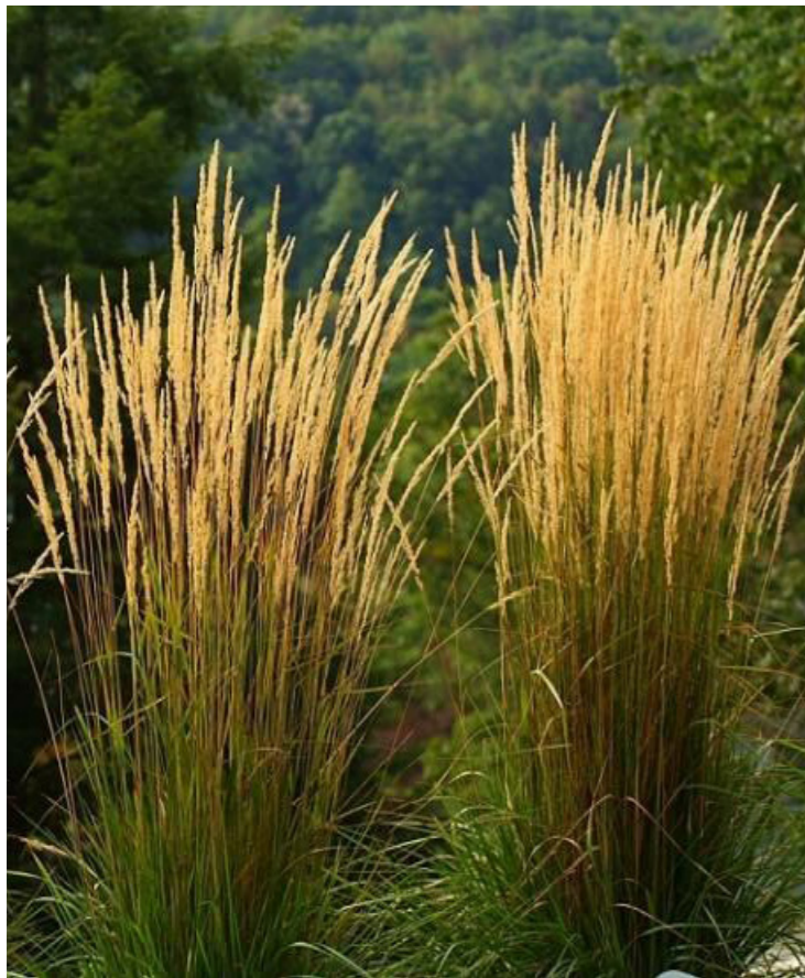
Calamagrostis acutiflora ,Karl Foerster‘