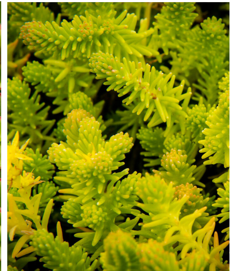
Sedum sexangulare ‚Weisse Tatra‘