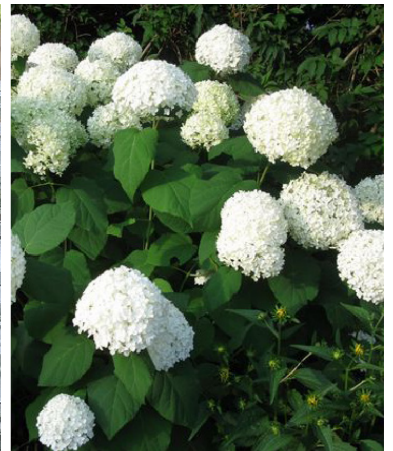
Hydrangea arborescens ,Annabelle‘