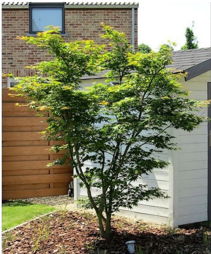
Acer palmatum ,Osakazuki‘