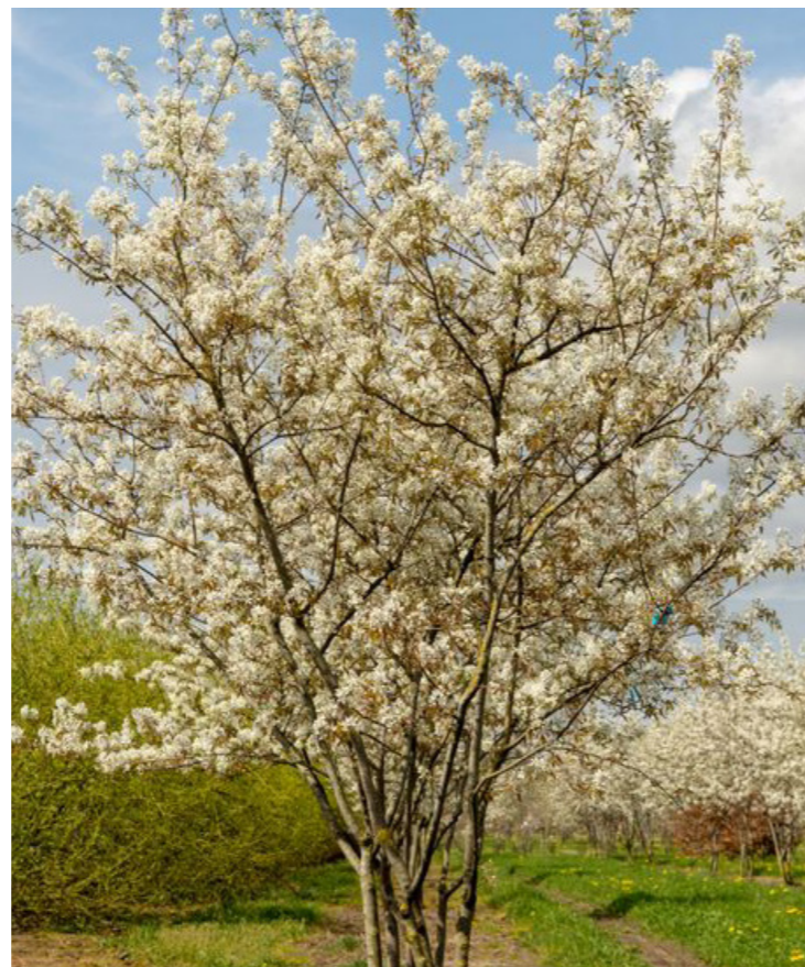
Amelanchier laevis ,Snowflakes‘